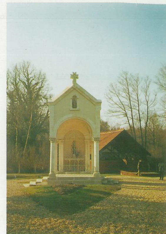
La " Belle Fontaine "