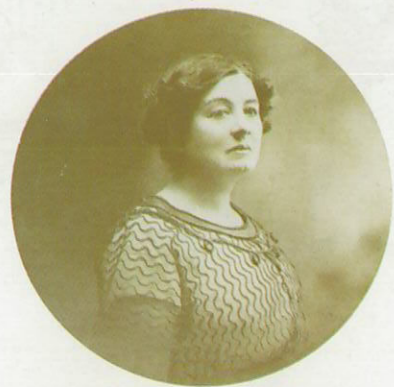
L'écrivain Marguerite Audoux vécut à Sainte - Montaine de 1876 à 1881.