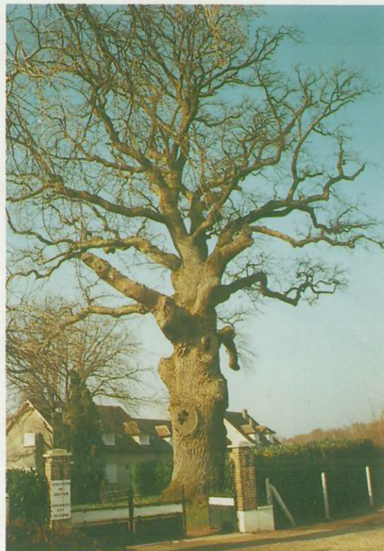
Le Gros Chêne ( 9 m de circonférence )