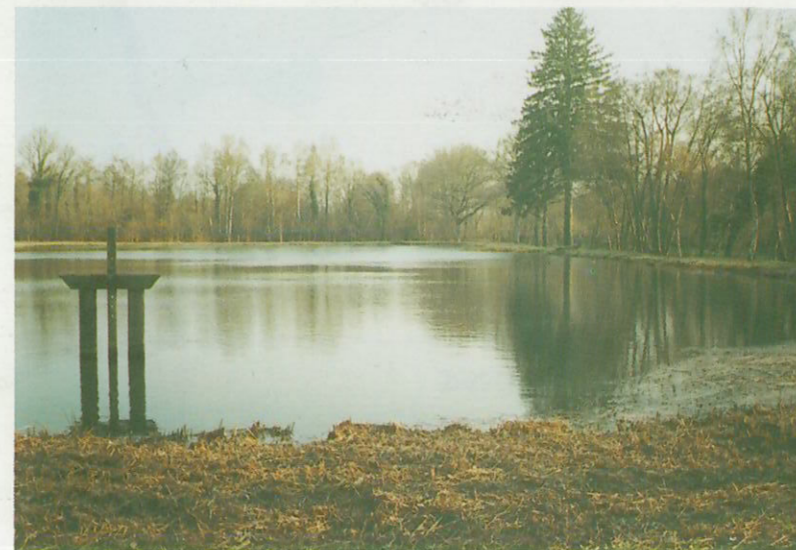
L' Etang communal